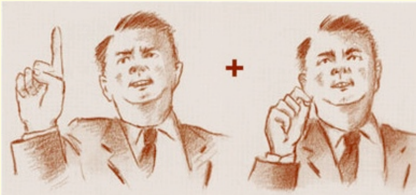
La mano prima nella forma di “I” e poi nella forma di “G”