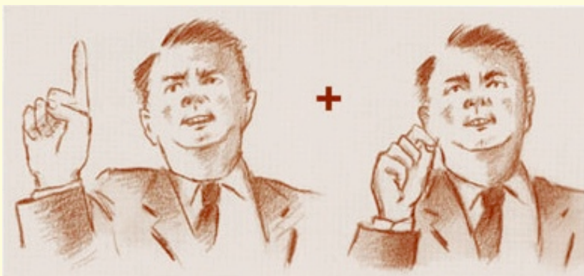
La mano prima nella forma di “I” e poi nella forma di “G”